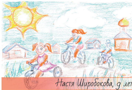
Настя Широбоква, 9 лет