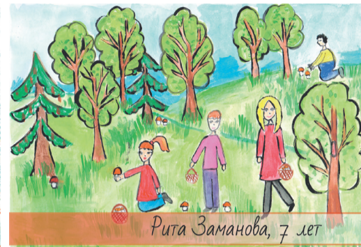
Рита Заманова, 7 лет

Ребята постарались на славу. С помощью фломастеров, красок и карандашей они рассказали о своих семейных традициях, среди которых совместные праздники, походы, прогулки в лесу, катание на лыжах, приготовление рождественского печенья и другие.